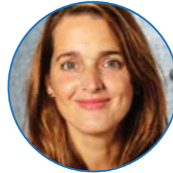
Juf Beens groep 2