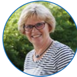
Juf Rorije groep 1