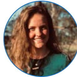
Juf Huttinga groep 5 en 6