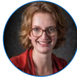
Juf Keuken groep 1