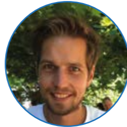
Meester Visscher groep 3 en 4