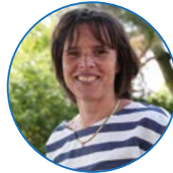
Juf Mosterd groep 3 en 4