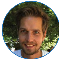
Meester Visscher groep 3 en 4