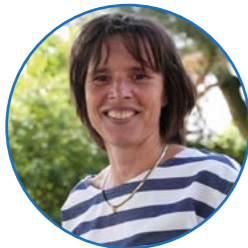
Juf Mosterd groep 3 en 4