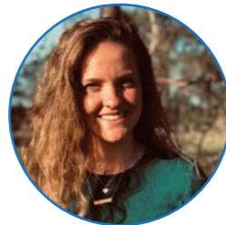
Juf Huttinga groep 5 en 6